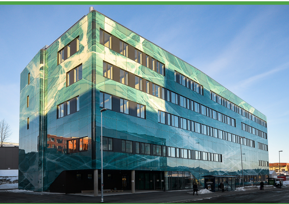
PET-senteret, UNN Tromsø